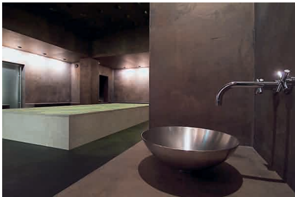
Kernstück im Hotel Schweizerhof in Lenzerheide ist das grosszügige Hamam.

Das Team des Hauses versteht es, die Komponenten Luxus, Design und Kompetenz auf eine sehr menschliche und ehrliche Art zu verbinden. Deshalb gilt das Haus heute als Referenz sowohl für die Schweizer Luxus-Hotellerie als auch für die Wellness-Kultur made in Switzerland.