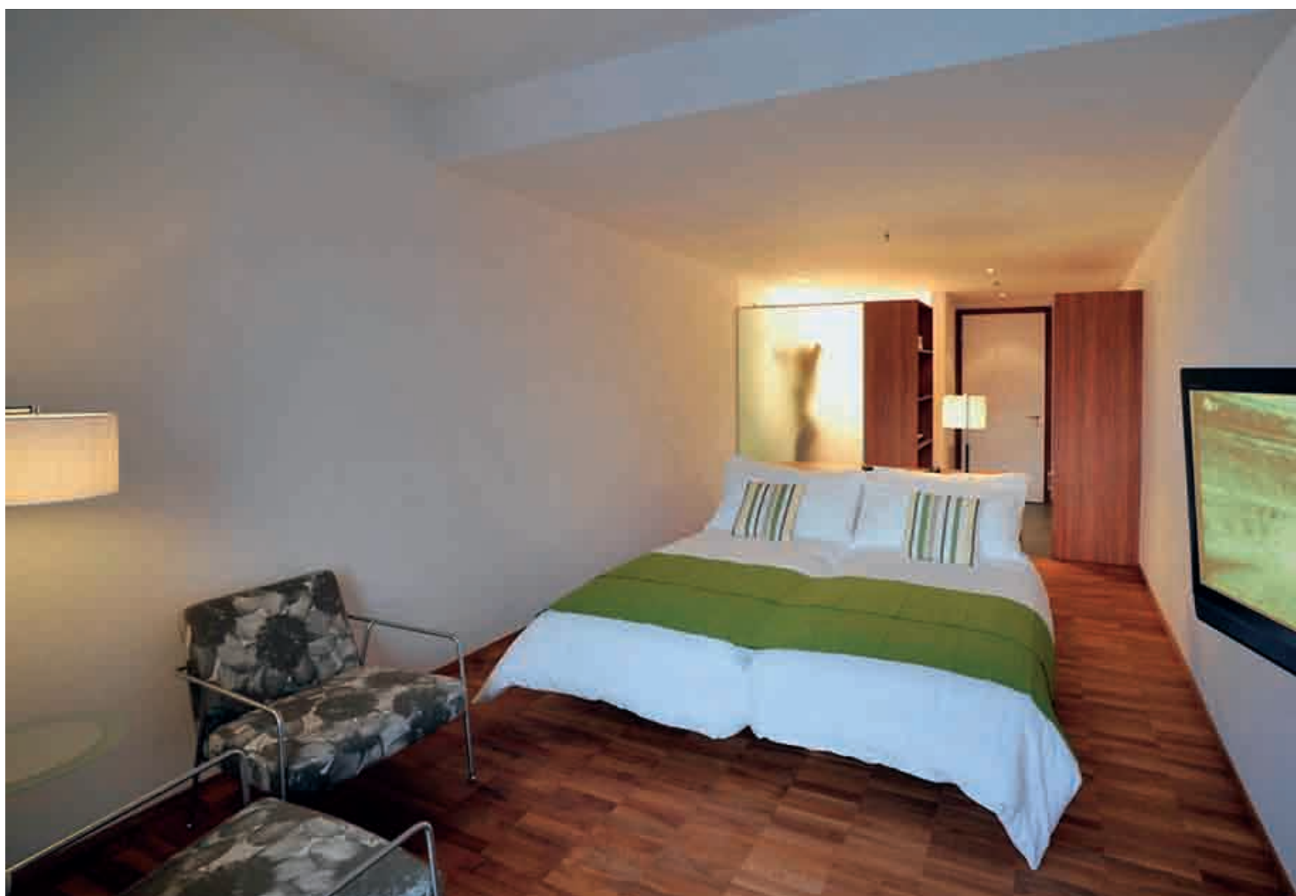
Hotel Rössli in Weggis: moderne Zimmer und ganzheitliches Angebot.

Es ist nicht zu übersehen: Die Schweiz ist im Aufbruch! Viel wird berichtet über immense Investitionen in neue und spannende Wellness- und Spa-Projekte. Doch können wir es wirklich mit unseren Nachbarländern aufnehmen? Österreich, Südtirol, Deutschland und auch Frankreich haben sich über viele Jahre als Vorreiter im Bereich Spa- und Gesundheitstourismus etabliert. Sie geniessen auch bei der Schweizer Bevölkerung immer noch einen erheblichen Vertrauensvorsprung, wenn es darum geht, den passenden Ort für eine Auszeit im Namen der eigenen Gesundheit zu finden.