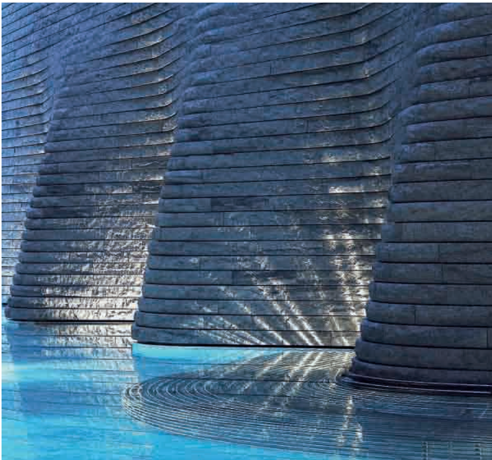
Bergoase des Tschuggen Grand Hotel – ein Ort der Kraft.

Im Hotel Rössli wird das Wellnessrad nicht neu erfunden. Aber der Wellnessgedanke nach den vier Säulen der Gesund-