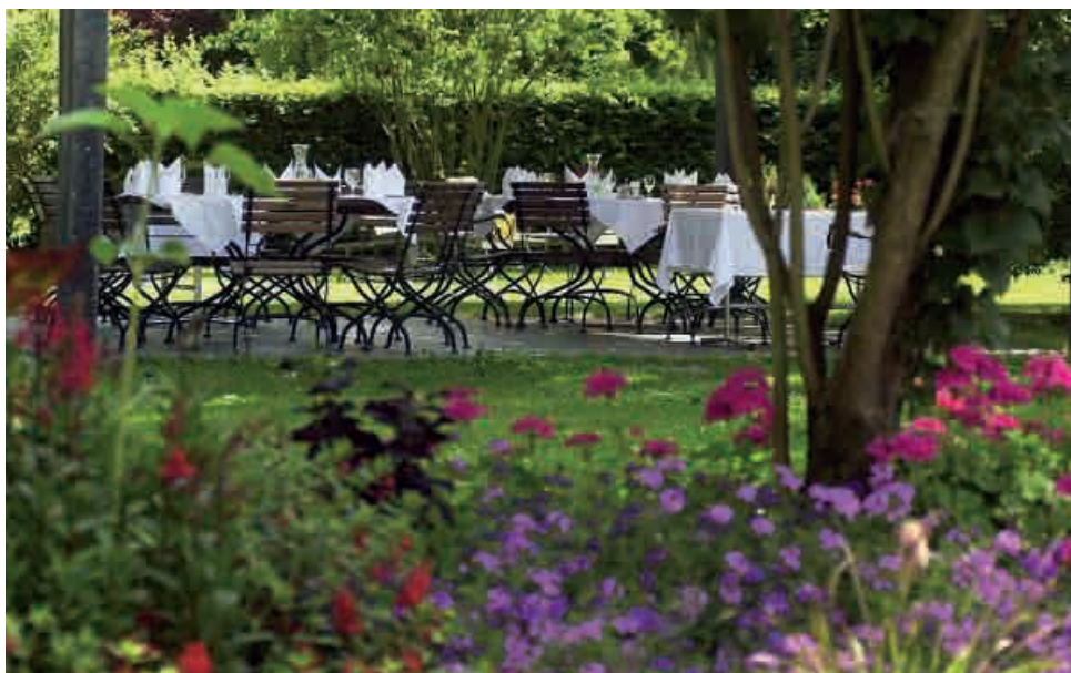
Balsam für die Seele im Garten des Hotels Eden in Rheinfelden.

heit wird konsequent durch alle Ebenen hindurch gelebt und mit einer hohen Qualität umgesetzt. Für uns ist es der lebendige Beweis, dass auch in der Schweiz eine regenerierende Auszeit beim Wellnessaufenthalt zu moderaten Preisen möglich ist.